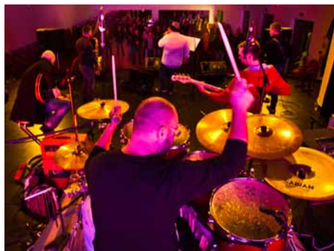
Decembrski rock koncert v združnem domu.