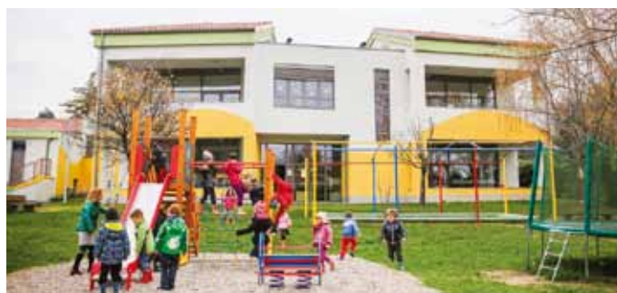
programi" in Mestna občina Koper. Energetska sanacija starega dela vrtca je znašala nekaj manj približno 189 tisoč evrov, od katerih je bilo 85 odstotkov financirano iz kohezijskega sklada.