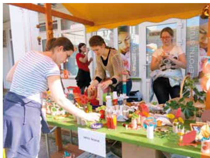
...vrtec, domači pridelovalci in pridne roke krajanov...