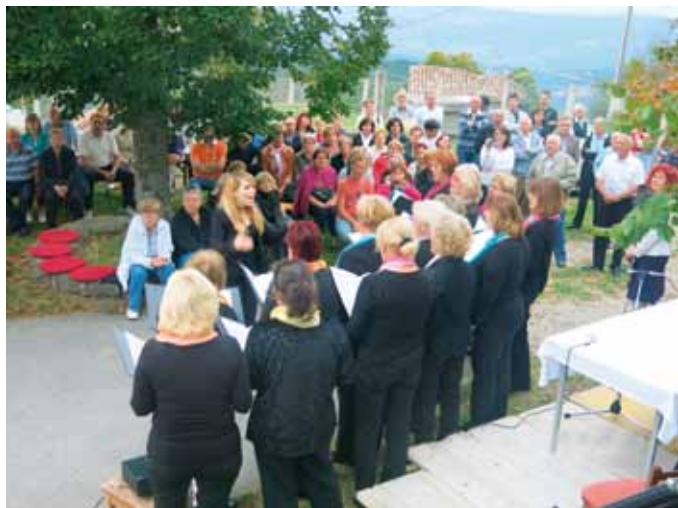
Prireditve na Tinjanu »Antignan, bela vista ma poco pan«, ki jo je pripravilo društvo Istrski grmči.