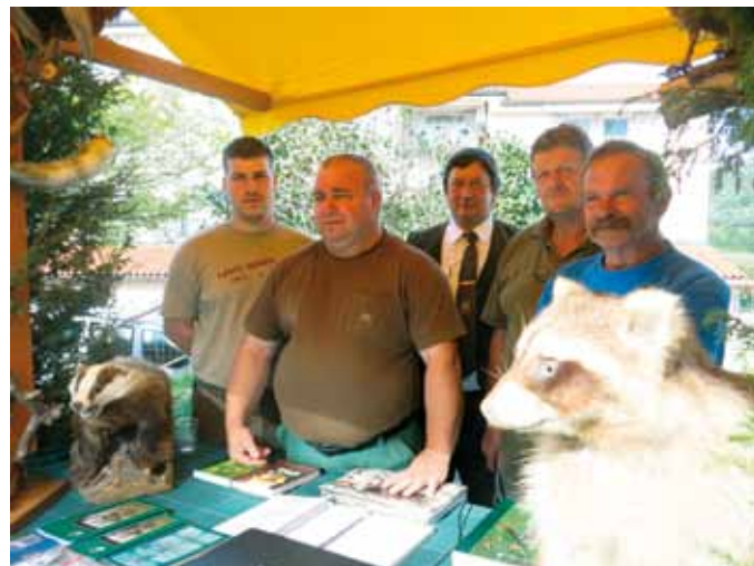
Na tradicionalni oktobrski prireditvi „Praznik vina in oljk“ so se predstavili lovci...