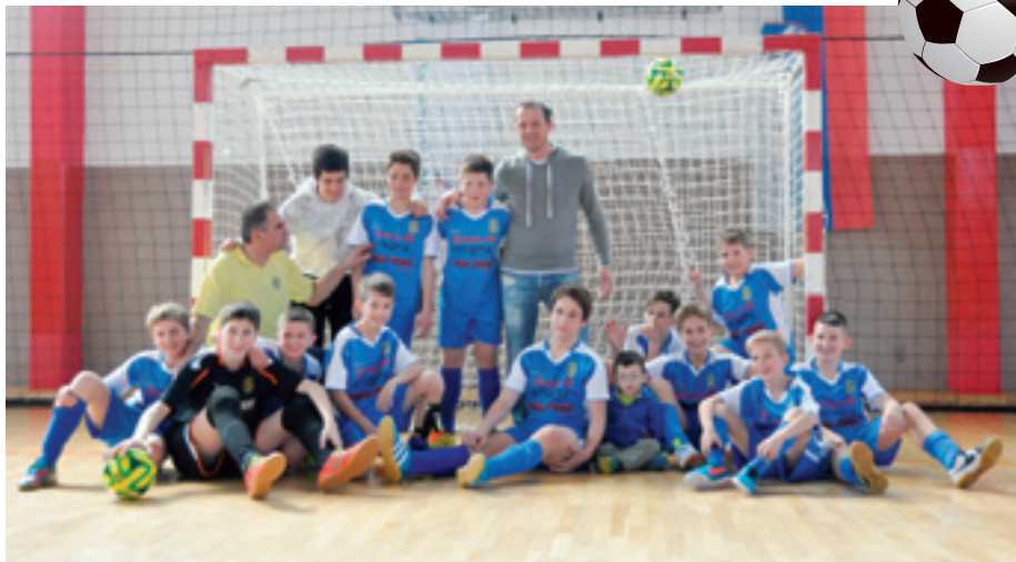
Na fotografiji selekcija U13

Sezona 2014/2015 je prinesla dokončno potrditev, da je malonogometni klub iz Škofij pomemben dejavnik v slovenskem športu in gonilna sila razvoja malega nogometa na obalno kraškem področju. V sezono se je podalo skoraj 200 igralcev v sedmih starostnih kategorijah. Sedaj, ko je sezona zaključena, lahko ugotovimo, da so čisto vsi dosegli, nekateri pa celo presegli pričakovanja. Najstarejši veterani nad 35 let so osvojili 3. mesto v ligi obalnih veteranov. Pomlajena ekipa članov si je uspela zagotoviti obstanek v prvi ligi in bo naslednjo sezono že 11 leto zapored nastopala na najvišjem državnem nivoju. Ekipa starejših mladincev (U21) je bila do konca prvenstva v igri za državnega prvaka. Osvojeno 3. mesto pomeni, da se na Škofijah ni bati za bodočnost tudi v članski konkurenci. Mladinci (U19), za katere so nastopali večinoma 16 let stari fantje, so letošnjo sezono izkoristili kot pripravo na naslednjo, ko bodo skušali izboljšati letošnje 12. mesto. Kadeti